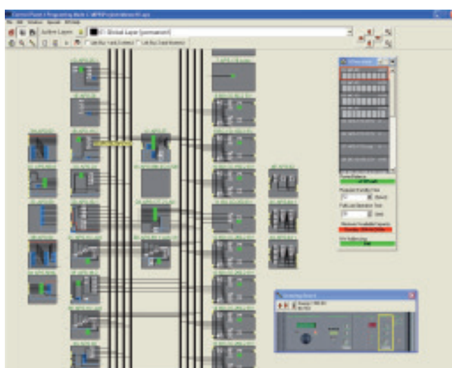
Intuitive Programmierung und einfachste, logische Verknüpfung zum Funktionsaufbau.