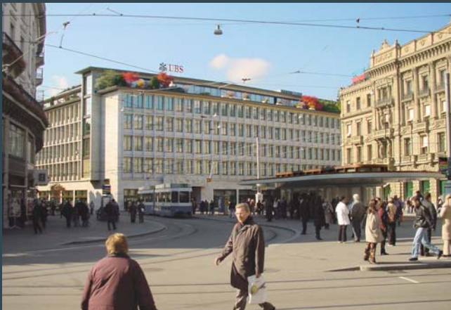
UBS en CREDIT SUISSE, Zürich Zwitserland