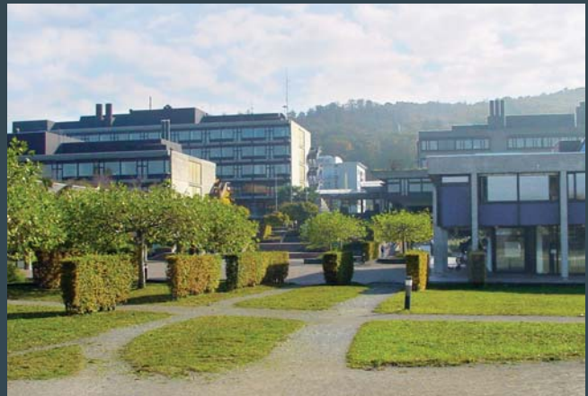
Universiteit, Zürich Zwitserland