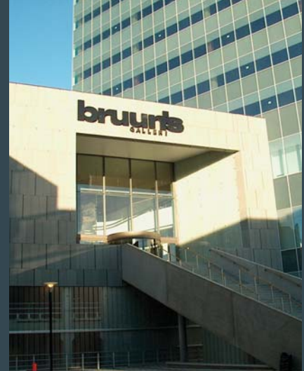
Winkelcentrum Bruuns Gallery Aarhus, Denemarken