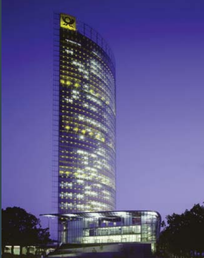
Post Tower, Bonn Duitsland