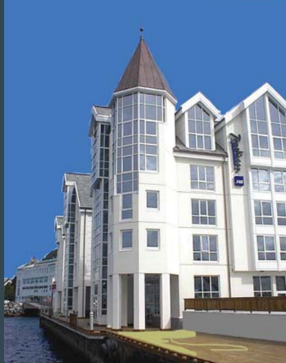
SAS Hotel, Aalesund Noorwegen